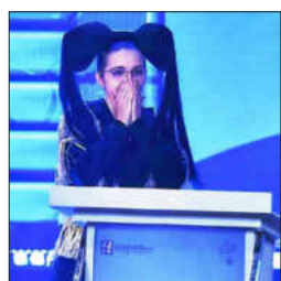
Dass sie gewinnen könnte, hielt Kirst bis zuletzt für unmöglich.