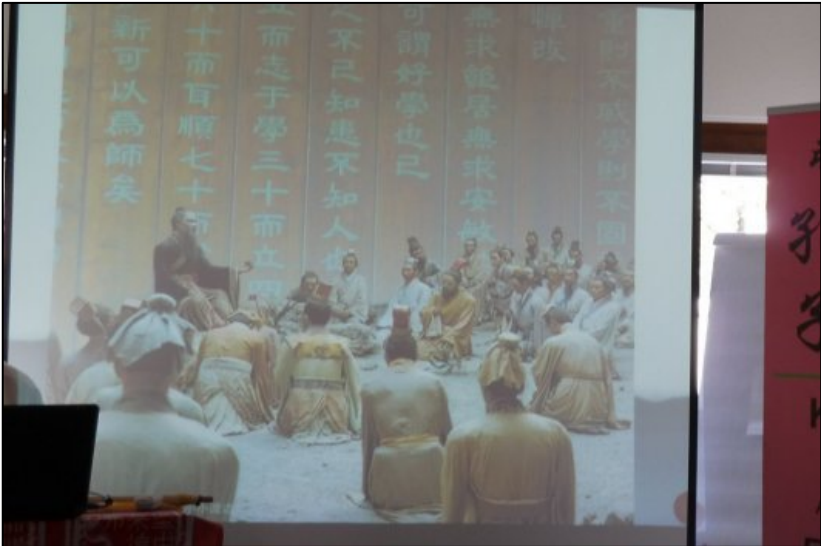
Konfuzius mit seinen Schülern

Staatliche Ehren erfuhr er, - nach seinem Tod. Er erhielt die Würde eines chinesischen Kaisers und wurde den Gottheiten gleichgestellt, und der Kaiser besuchte auch sein Grab. Statuen wurden errichtet.